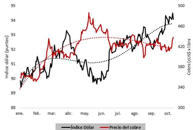
FIGURA 2: COMPORTAMIENTO DEL PRECIO DEL COBRE Y INDICE DÓLAR