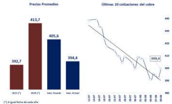
FIGURA 2: PRINCIPALES PARÁMETROS DEL MERCADO DEL COBRE