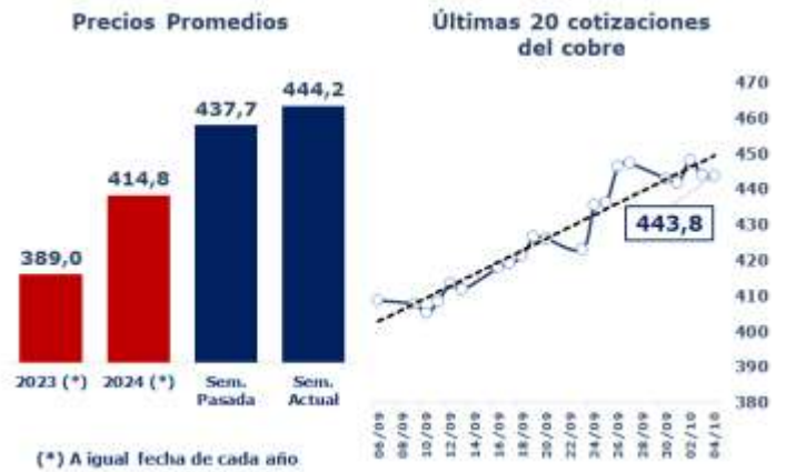
TABLA 1: PRINCIPALES PARÁMETROS DEL MERCADO DEL COBRE