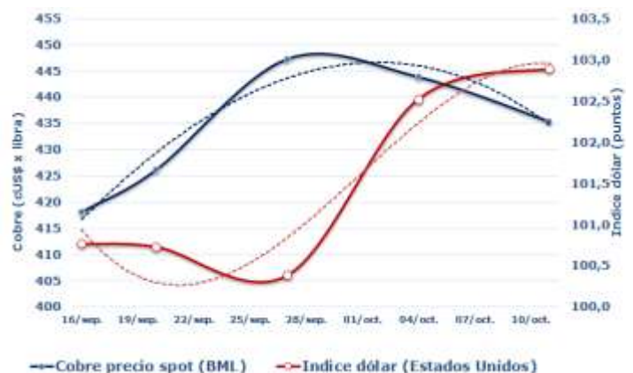
FIGURA 2: RELACIÓN PRECIO DEL COBRE E ÍNDICE DÓLAR