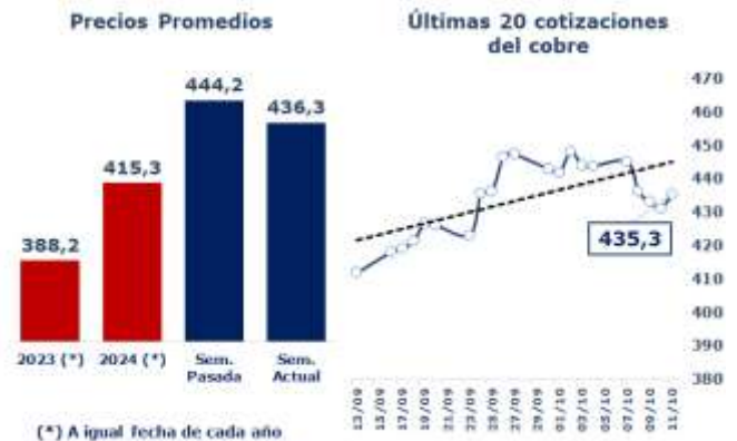
TABLA 1: PRINCIPALES PARÁMETROS DEL MERCADO DEL COBRE