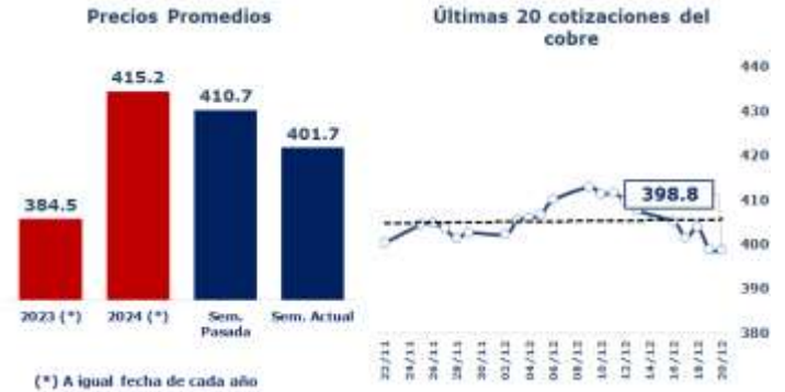
TABLA 1: PRINCIPALES PARÁMETROS DEL MERCADO DEL COBRE