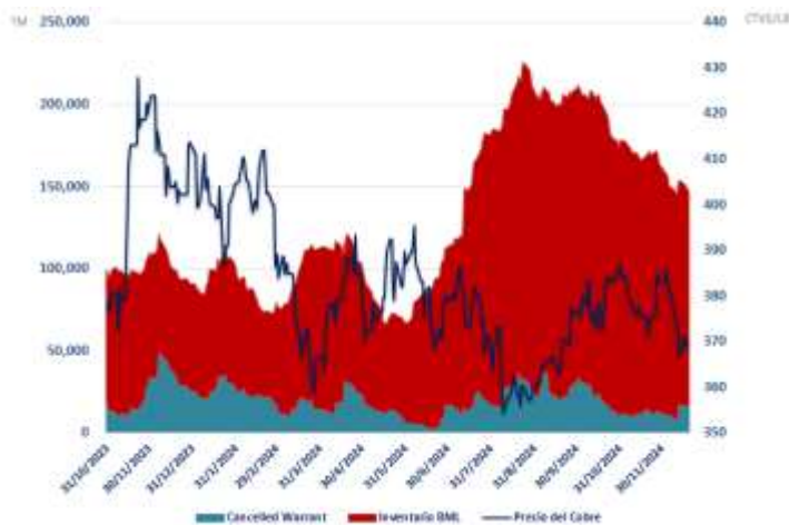
FIGURA 3: RELACIÓN ENTRE INVENTARIOS Y PRECIO DEL COBRE